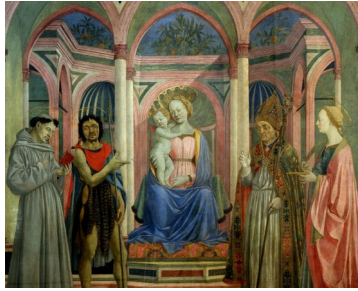
Domenico Veneziano: "Retablo de Santa Lucia de' Magnoli" (sala 7)