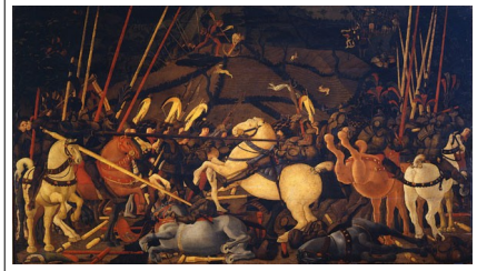
Paolo Ucello: "Batalla de San Romano" (sala 7)