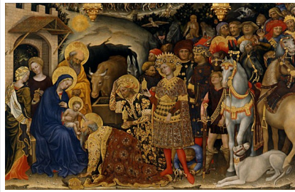
Gentile da Fabriano: "Adoración dos Reis Magos" (sala 7)