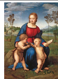
Rafael Sanzio: "Madonna do xilgaro" (sala 66)