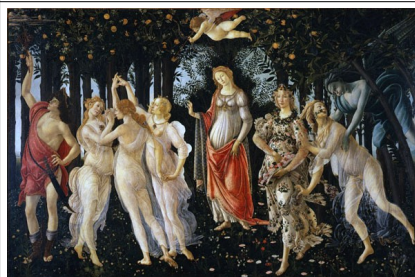
Sandro Botticelli: "A primavera" (salas 10/14)