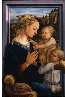
Filippo Lippi: "Virxe co Neno e anxos" (sala 8)