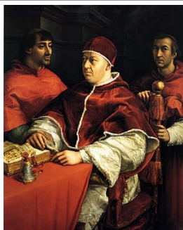
Rafael Sanzio: "Retrato do Papa León X e cardeais" (sala 66)