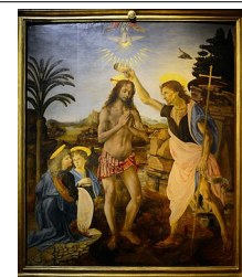
Verrocchio e Leonardo da Vinci: "Bautismo de Cristo" (sala 15)