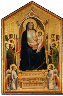
Giotto: "Maestà di Ognisanti" (sala 2)