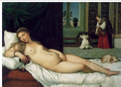
Tiziano: "Venus de Urbino" (sala 83)