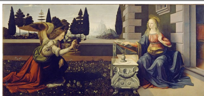
Leonardo da Vinci: "Anunciación" (sala 15)