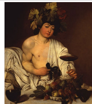
Caravaggio: "Baco" (sala 90)