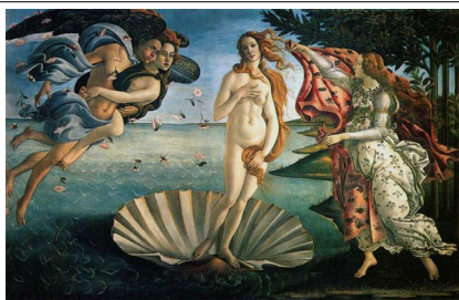
Sandro Botticelli: "Nacemento de Venus" (salas 10/14)