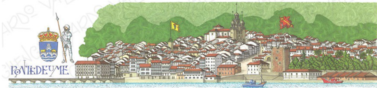
Perfil urbano. Autor: Checho Pardo Valdés

Identifica, no seguinte perfil urbano, os elementos que máis che poidan chamar a atención da vila de Pontevedra (actividades económicas, espazos urbanos diferenciados, estado de conservación das edificacións, contraste entre edificacións,...):